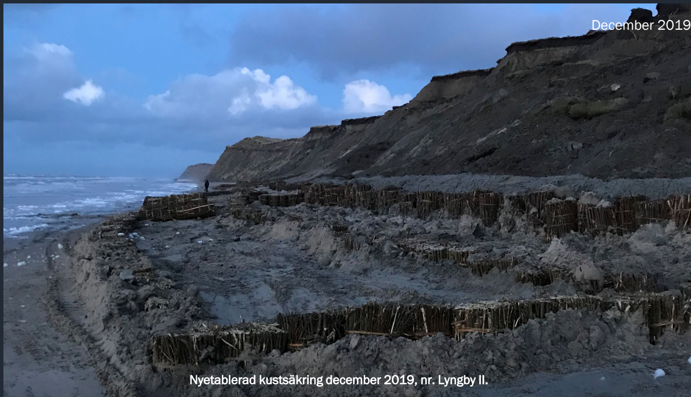
Bild av utvecklingen i den nyetablerade anläggningen från december 2019 till början av januari 2020 efter att de första stormarna haft effekt. Anläggningen har nu påbörjat sin utveckling mot att "naturligt lagra sand" i kustlinjen.