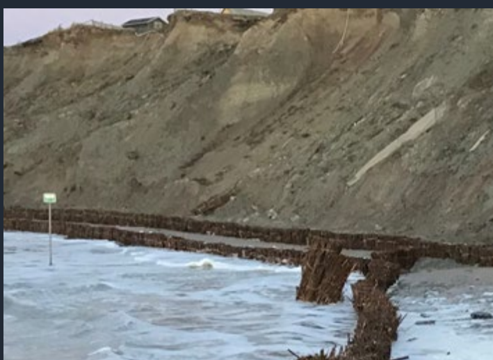
Nyletablerad anläggning. Pilbuntar är monterade 70 cm över marknivån.