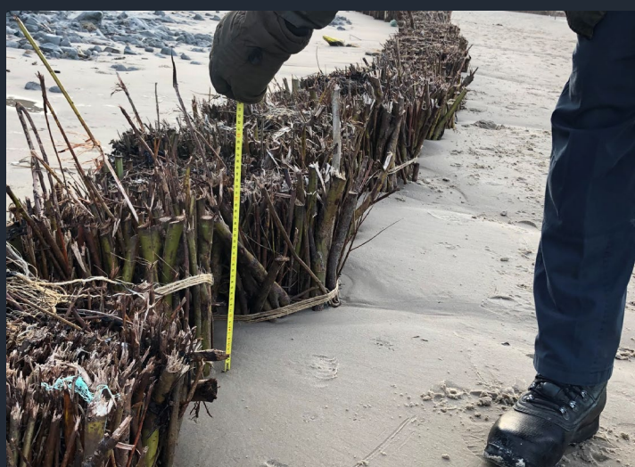
Stranden är upphöjd och pilbuntarna är nu 30 cm över marknivån