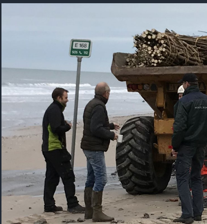
Anläggningen har "skördat" sand från havet och dess omgivning i 9 månader. Stranden har höjts och pilbuntarna sträcker sig nu 5-15 cm över marknivån.